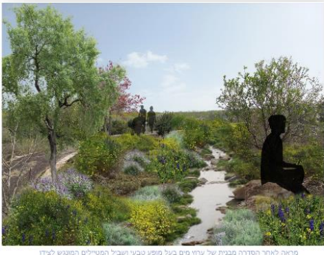
מראה לאחר הסדרה מבנית של ערוץ מים בעל מופע טבעי ושכיל המטיילים המונגש לציוד

הפרויקט יהווה אבן דרך בתוך השבה ושיקום של בתי גידול לחים וישמש כמודל לפרוייקטים עתידיים מסוג זה ולאיוון הנדרש שבין האדם, החקלאות והסביבה. במקביל, מוגשת לקרן בקשה לתקצוב פרויקט תכנון אקולוגי כלכלי, אשר בוחן את המשמעויות הכלכליות של פיתוח ושיקום בתי גידול לחים בדגש על העלויות הנגזרות וביצוע הפרויקט והתועלות הנגזרות ממנו.